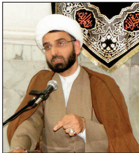
حجت‌الاسلام محمد معرفت استاد حوزه و دانشگاه