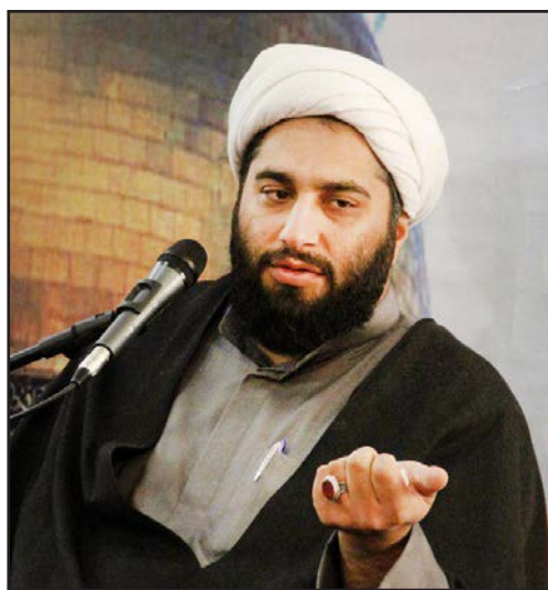
حجت‌الاسلام حامد کاشانی پژوهشگر و واعظ