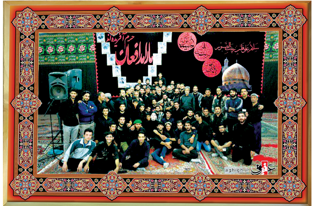
[ هیئت رزمندگان اسلام، استان کرمانشاه ]

جایگاه زن و نوع حضور او در جامعه اسلامی یکی از مسائل مهمی است که حتی در تعیین سرنوشت جامعه نقش دارد. برای همین دین اسلام به عنوان کامل‌ترین دین آسمانی توجیه خاصی به این موضوع داشته و احکام و دستورات روشنی در مورد چگونگی حضور زن در اجتماع و اهمیت حجاب برای او صادر کرده. از دیدگاه اسلام حفظ عفت و پاکدامنی زنان نقش تعیین‌کننده‌ای در سالم‌سازی جامعه اسلامی دارد و حتی حفظ جایگاه و منزلت زن به حفظ حجاب و عفت او برمی‌گردد. یکی از راه‌های اساسی دشمن جهت ضربه زدن به اسلام و نظام جمهوری اسلامی، ترویج و حمایت از بی‌بندوباری و مقابله با حجاب و عفاف است. در نگاه اسلام، حفظ حجاب و عفاف نقش مهمی در حفظ منزلت زن و سلامت جامعه اسلامی و ارزش‌های اسلامی دارد. در واقع از روزهای اولیه هجوم استعمارگران اروپایی به ممالک اسلامی این حربه برای ضربه زدن به اسلام مورد استفاده قرار گرفته. در شرایط کنونی نیز دشمن با انواع روش‌ها اعم از راه‌اندازی شبکه‌های مبتذل ماهواره‌ای، ساختن سی‌دی‌های مستهجن و ترویج آنها در سطح جامعه، حمایت از جریان‌های فمینیستی و... قصد دارد ضمن مقابله با اعتقادات اسلامی و به ابتدال کشاندن جوانان، جامعه ایران را با مسائل بی‌ارزش سرگرم کند و آن را از دستیابی به آرمان‌های خود باز دارد. از این رو به همه بچه‌هیئت‌ها پیشنهاد می‌شود این مسئله را جدی بگیرند و با مطالعه گسترده در این زمینه تلاش کنند جوانان ما حجاب را با عشق انتخاب کنند.