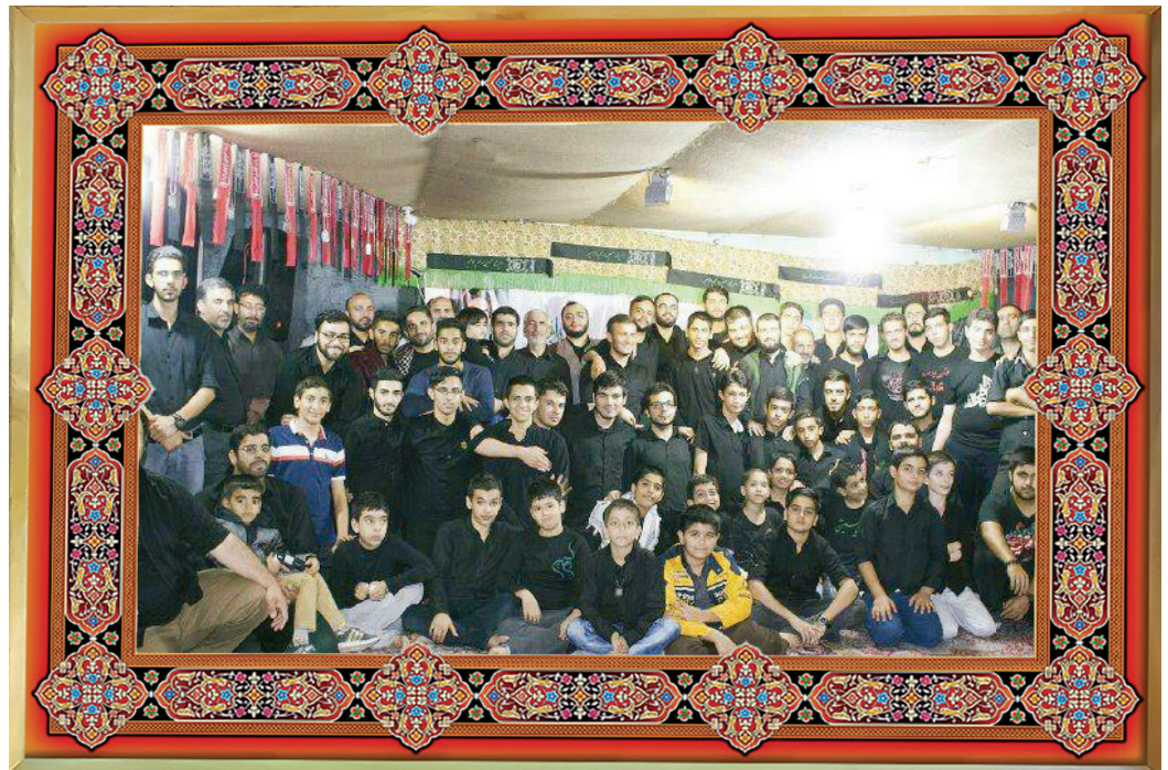
[ عکس یادگاری: هیئت حضرت حسین بن علی (علیه السلام) منطقه ۱۸ تهران ]