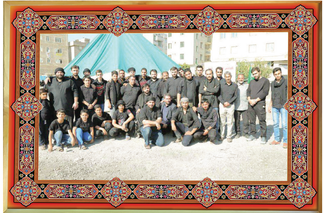
[ عکس یادگاری: روضه انصارالحسین علیه‌السلام ، روز عاشورا، محرم ۹۵، مراسم خیمه‌سوزان، حسینیه حضرت زینب علیها‌السلام ]