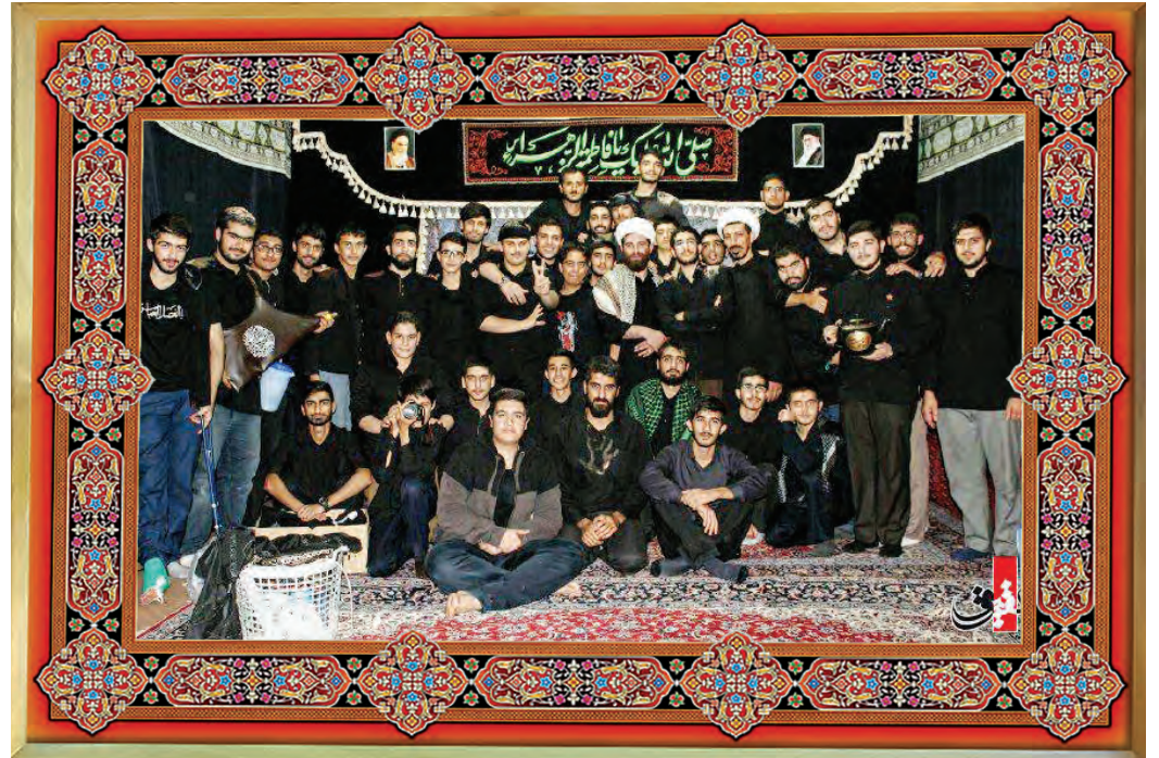
[ هیئت محمد رسول الله ص ، تهران مؤسسه فرهنگی حجت‌الاسلام شهید حسین اسکندری، شام غریبان، محرم ۹۵ ]