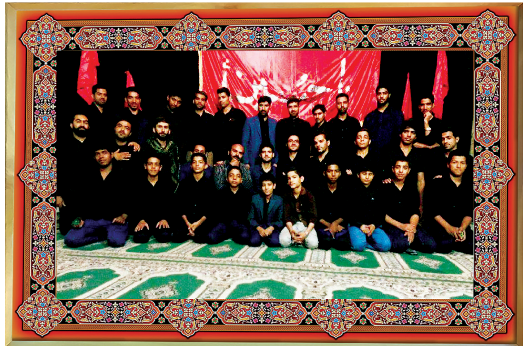
[ عکس یادگاری: هیئت انصارالمهدی شهرستان عنبر آباد، شام غربیان ۱۳۹۵ ]

«بین خوبان جهان هیچ کس مثل تو نیست / پدرم هیچ زمان هیچ کس مثل تو نیست». احترام به والدین و قدرشناسی از زحمات پدر و مادر از مهم ترین توصیه های دینی است. انسان تا وقتی خودش پدر نیست نمی تواند این موقعیت را درک کند که پدرش برای او چه زحماتی کشیده. این را زمانی می فهمد که خودش پدر شود. یا در شرایط بدتر زمانی متوجه می شود که پدر خود را از دست می دهد و احساس می کند پشتش به جایی گرم نیست. پس باید احترام به پدر را نگه داریم چراکه حرمت نگهداشتن این بزرگان علاوه بر اینکه وظیفه ماست، برکت را هم به زندگی جاری می کند. طوری نباشد که دیر به دیر به آنها سر بزنیم و صله رحم در خصوص والدین خود را با تفریح و مشغله های زندگی جایگزین کنیم. هر چیزی جای خود را دارد. هر قدر هم که دغدغه های زندگی امروزی فرصت را از شما بگیرند، نباید دل به دل این دلمشغولی ها بدهید و از دید و بازدید پدر و مادر تان غافل شوید. دعای خیر آنهاست که باعث می شود در زندگی خود کسب و کار بهتری داشته باشید. طوری رفتار کنید که وقتی آنها را از دست دادید آه نکشید که ای کاش این کار را برای پدر یا مادرم انجام می دادم. اگر مشکلات زندگی شما را از اینها دور کرده، ولادت حضرت علی (علیه السلام) فرصت خوبی است تا این روز را نقطه عطفی در زندگی تان قرار دهید برای تداوم احترام و صله رحم به آنها.