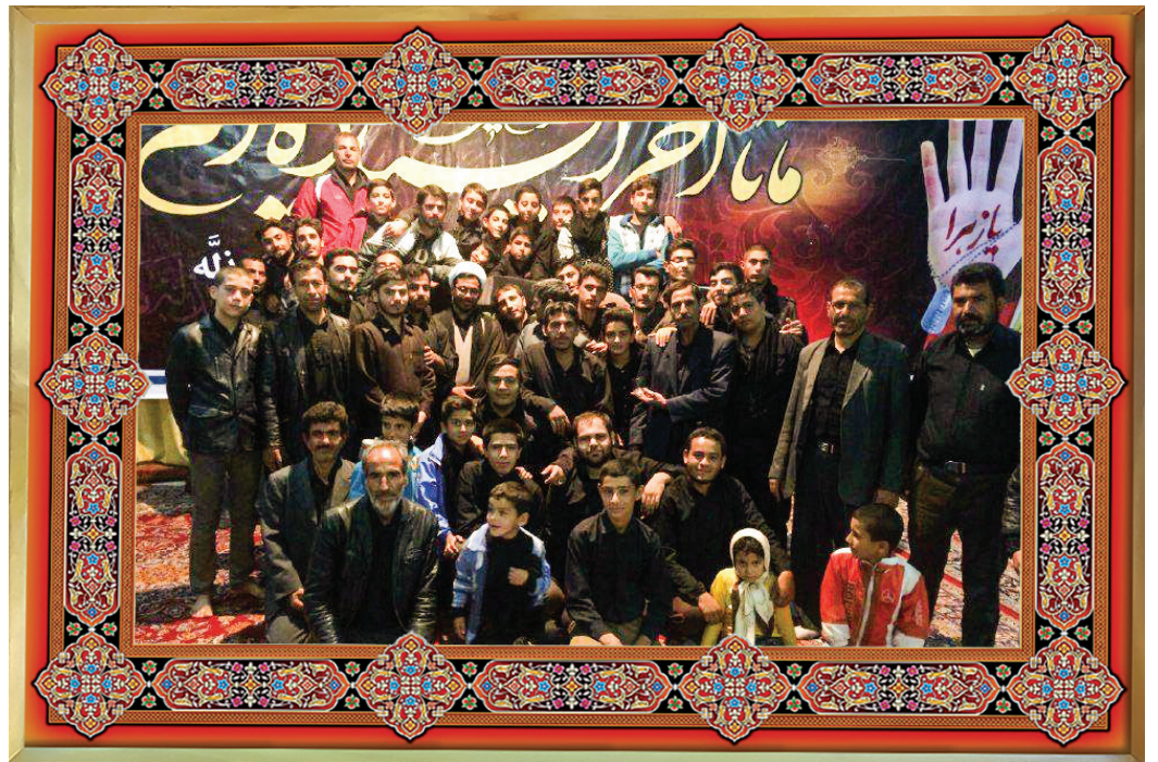
مجتمع فرهنگی مذهبی مسجد و حسینیه حضرت ابوالفضل علیه‌السلام - اصفهان - روستای ایرج / هیئت انصارالمهدی علیهم‌السلام

یکی از سنت‌های زیبای هیئت‌های قدیمی گرفتن عکس یادگاری با کتیبه و پرچم هیئت بوده که در این سال‌ها فراموش شده است. پیشنهاد می‌کنیم دست به کار شوید و پس از پایان مجلس تان یک عکس یادگاری دسته‌جمعی بگیرید و برای «چهارده» ایمیل کنید تا در همین صفحه منتشر شود. qudsonline14@gmail.com