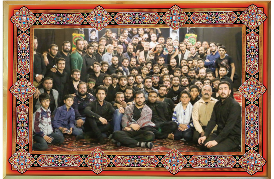
[ هیئت فاطمیون شهر الوند(استان قزوین) ]