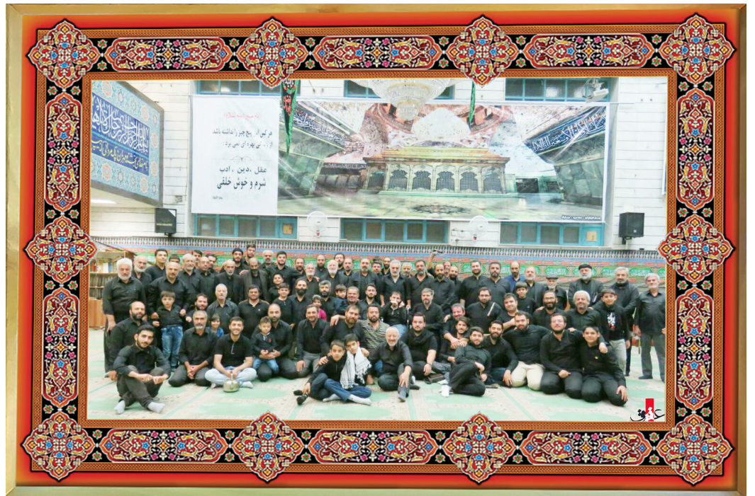
[ هیأت باب‌الحوایج / شام غریبان محرم ۱۴۳۸ ]

از پیامبر اکرم صلی الله علیه و آله نقل شده وقتی حضرت موسی علیه السلام با حضرت خضر علیه السلام ملاقات کرد، حضرت موسی از او خواست موعظه‌اش کند. حضرت خضر گفت ای کسی که جوایب دانشی! بدان که گوینده کمتر از شنونده خسته می‌شود. پس هیچ‌گاه اهل مجلس خود را خسته نکن. درباره آداب صحبت کردن سفارش‌های زیادی شده که این فقط یکی از آنهاست. در واقع درباره حرف زدن با دو مسأله طرفیم، اول نوع بیان و آداب گفت‌وگو بین طرفین و دوم مطالب و مباحثی که قابل طرح در معاشرت با دیگران و جلسه سخن است. درباره هر کدام با جزئیات به مواردی اشاره شده. مثلاً گفته‌اند زیبا باشد و خریدار داشته باشد، نرم و ملایم باشد و از روی علم و آگاهی باشد، بی‌فایده و مستهجن نباشد و پاکیزه باشد و پاسخ کسی را ناراحت نکند. یکی دیگر از آداب سخنوری، گوش دادن به حرف‌های دیگران است. امام صادق علیه السلام در این خصوص فرموده: «سه چیز دلیل درست‌اندیشی است: برخورد خوب با مردم، گوش فرا دادن به گفتار مردم و خوب پاسخ دادن به سوال اشخاص». ابراهیم بن عباس درباره این خصلت از امام رضا علیه السلام مثالی آورده با این مضمون: «هیچ‌گاه ندیدم امام رضا علیه السلام کلام کسی را تا به پایان نرسیده قطع کند».