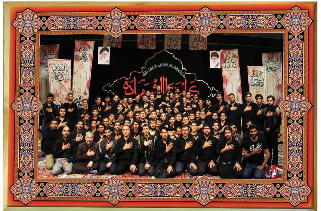
[ عکس یادگاری جمعی از خادمین هیأت ثارالله زنجان / محرم الحرام ۱۴۳۸ ]

امام سجاده (علیه‌السلام) از شخصی پرسید از دوستانت کسی بر تو وارد می‌شود که هر چه نیاز دارد بدون اجازه از کیسه‌ات بردارد؟ مرد گفت نه. امام فرمود بنابراین شما با یکدیگر دوست و برادر نیستید. تعریف رفاقت و دوستی در همین یک خط روایت از امام سجاده (علیه‌السلام) است. مسأله‌ای که همیشه روی زندگی و مسیر آدمیزاد تأثیر می‌گذارد و گاهی به آنها آگاه هستیم و گاهی نه. به خاطر همین است که امیرالمؤمنین (علیه‌السلام) فرموده: «از هر چیزی جدیدش را انتخاب کن اما از دوستان قدیمی‌اش را». در باب این موضوع توصیه‌های زیادی کرده‌اند. مثلاً گفته‌اند دوستی را انتخاب کن که تقوا داشته باشد و حتماً او را از دوست داشتنت مطلع کن. یا گفته‌اند دوست و برادر واقعی تو کسی است که لغزش و اشتباهت را ببخشد، عزت را بپذیرد و عیب‌هایت را بپوشاند. همیشه به حفظ دوستی هم سفارش شده. به عنوان مثال از امام صادق (علیه‌السلام) روایت شده: «هر وقت دوستی داشتی که به ریاست رسید و آن موقع با یک‌دهم حقی که قبل از ریاستش برعهده او داشتی با تو برخورد کرد، بدان دوست خوبی است». در روایات مختلف درباره معیار انتخاب دوست سفارش‌های زیادی شده. مثلاً امام صادق (علیه‌السلام) فرموده: «هر گاه از آشنایان و برادرانت کسی بود که سه بار بر تو عصبانی شد اما درباره‌ات چیز بدی نگفت، او را به دوستی خود انتخاب کن». امام جواد (علیه‌السلام) تعبیر عجیبی درباره دوست بد دارد: «با انسان‌های شرور دوستی نکن. چون مانند شمشیر آخته‌ای هستند که قیافه‌شان زیباست اما اثرشان زشت و ناپسند است». به عنوان آخرین کلید می‌توان به حکمتی از لقمان اشاره کرد که گفته: «دوست را نمی‌شناسی مگر وقتی به او نیاز پیدا می‌کنی».