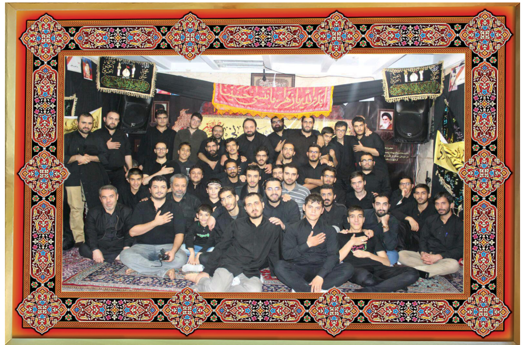
[محل عاشاق المهدی (ع) مشهد مقدس، شهرک شهید رجایی]