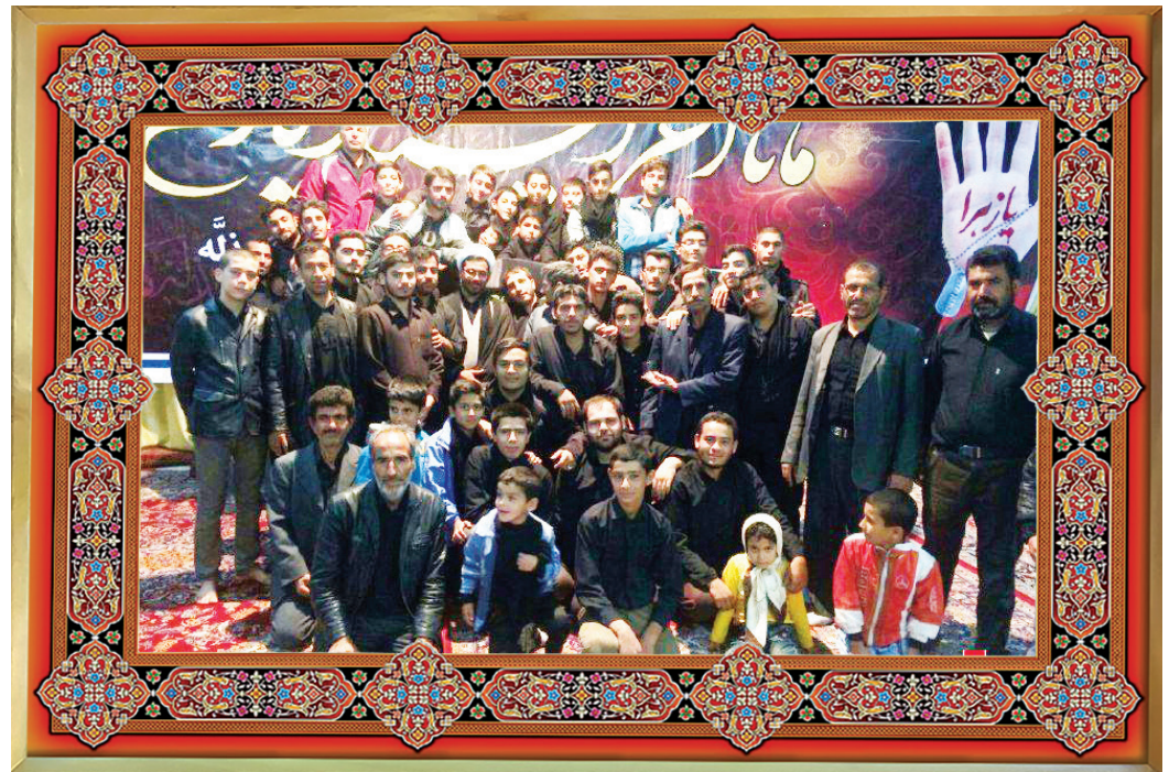
[ عکس یادگاری: مجتمع فرهنگی مذهبی مسجد و حسینیه حضرت ابوالفضل (علیه السلام) روستای ایرج / هیأت انصار المهدی (علیه السلام) ]