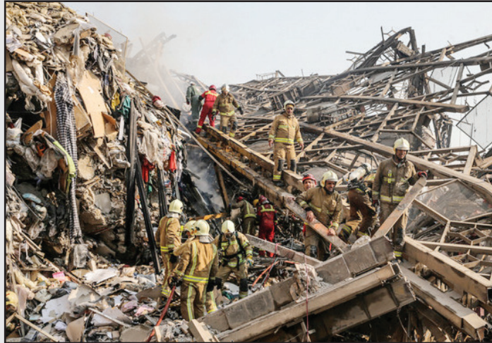
همه ایران در سوگ آتش نشانان حادثه پلاسکو