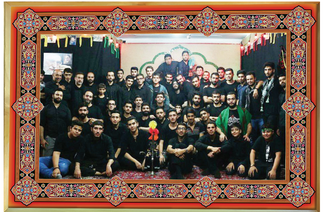
[ عکس یادگاری: هیأت مکتب المهدی، تهران، نازی آباد ]